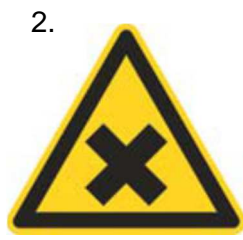
Nebezpečenstvo škodlivej alebo dráždivej látky