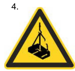
Nebezpečenstvo pádu alebo pohybu zaveseného bremena