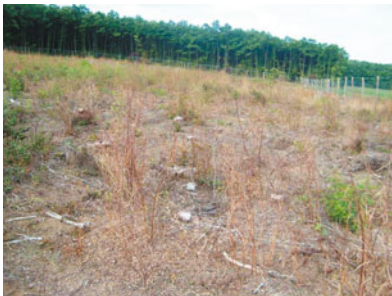
Obr.: Pohľad na chemicky ošetrovanú plochu s uhynutými agátovými výhonmi