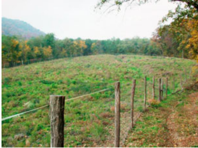
Obr.: Oplotenie chrániace zalesnenú plochu