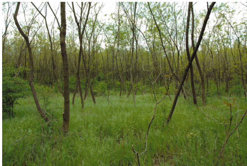
Trávníková úroveň porastov agátu je chudobná na druhy, pozostáva najmä z nitrofilných druhov

MIHÁLY B. – BOTTA-DUKÁT Z. (szerk.) (2004): Biológiai inváziók Magyarországon. Özönnövények. – A KvVM Természetvédelmi Hivatalának Tanulmánykötetei 9., TermészetBÚVÁR Alapítvány Kiadó, Budapest, 408 pp.