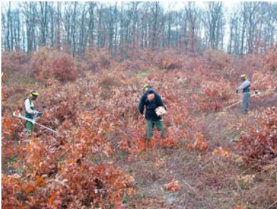
Benzinmotoros tisztítófűrészszel végzett mechanikus irtás