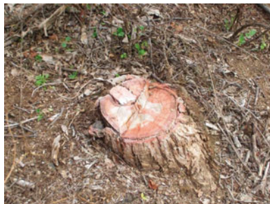
Obr.: Agátový peň ošetrený Garlonom