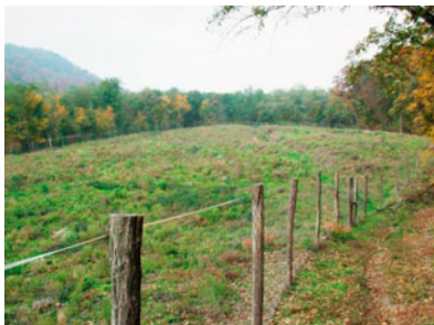
Erdőfelújítást védő kerítés