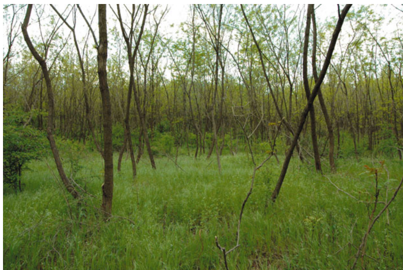
Az akácállományok gyepszintje fajszegény, főként nitrofil fajokból áll