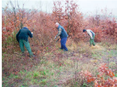
Obr.: Lesní robotníci s mačetami-mechanické ošetrovanie