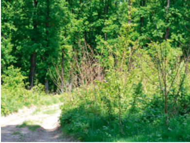
Vegyszeres irtás utáni látkép elszáradt akácсарjakkal, zöldelő kocsánytalan tölgy csemetékkel