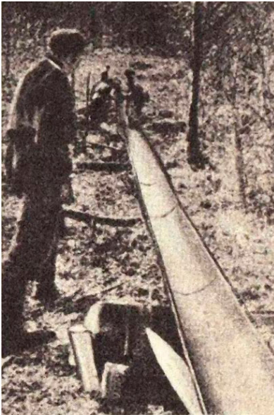
Obr.: Približovací šmyk v prevádzke

Zabezpečenie mobilného, skladacieho šmyku s funkčne vhodným navijákom v záujme ohľaduplnej technológie približovania dreva