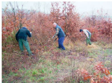
Sújtókéssel dolgozó erdei munkások – mechanikus ápolás