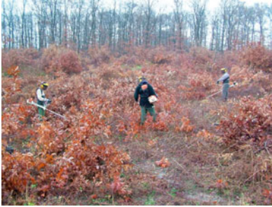
Obr.: Mechanické ničenie krovinozom