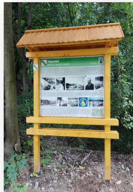
Informačná tabuľa Vápenka pri chate Majdán