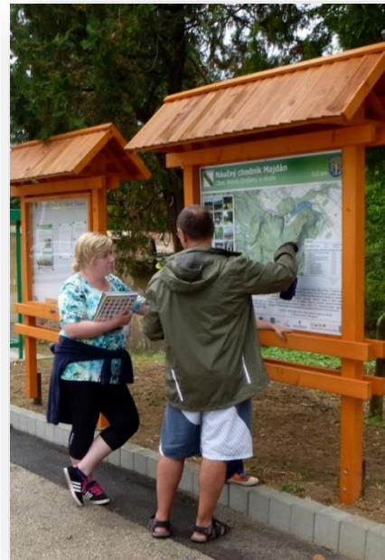
Začiatok LNCH Majdán

V blízkosti strediska sa nachádza solitér smreka obyčajného, ktorý dal vysadiť v roku 1848 gróf Móric Pálffy na počesť korunovácie cisára Františka Jozefa I. Dosahuje výšku 32 m a v tejto bukovej oblasti má okrem kultúrnej hodnoty mimoriadnu estetickú funkciu.