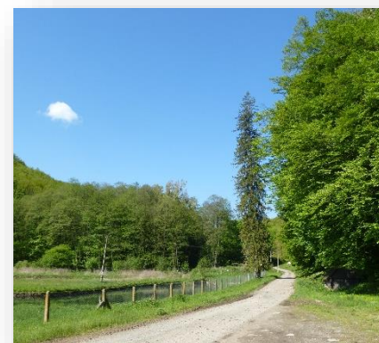
Smrek grófa Pálffyho