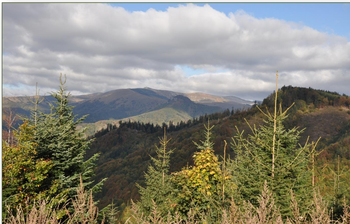
Pohľad z chodníka na Veľkú Fatru

V oblasti Starých Hôr a Španej Doliny sa v minulosti kvôli banskej činnosti v lesoch nadmerne ťažila drevná surovina. Významný slovenský lesník Jozef Dekret Matejovie (1774-1841) v ťažkých časoch vďaka svojej pracovitosti, inteligencii, predvídavosti a láske k prírode odvrátil ich nepriaznivý stav. Bol to človek, ktorý nás naučil pestovať les, jeho myšlienky sú inšpiráciou i pre lesníkov súčasnosti. Realizácia náučného chodníka upozorňuje na lesnícke témy, na výnimočnosť a technické pamiatky tejto lokality, pripomína ťažké boje počas druhej svetovej vojny a propaguje odkaz Jozefa Dekreta Matejovie: „zachovať lesy potomstvu“.