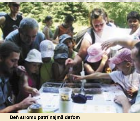
Deň stromu patrí najmä deťom