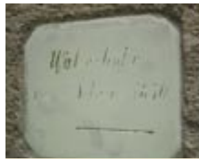
Označenie vys. vody 1850

Ďalšia horáreň, tiež pamätihodnosť, sa nachádza v malebnom prostredí na Starohájskej ceste, oproti kaplnke s kamenným krížom z roku 1869, na severnom okraji dostihovej dráhy na spojovacej cestičke zo Starého hája do Ovsíšť. Bola to bývalá Kokešova horáreň, neskôr hostinec u Hubera, ktorá sa spomína už v r. 1776 (J.Gustafík). Na bočnom priečelí domu je