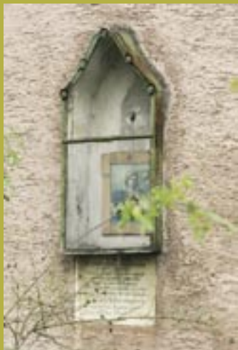
Nika na Starohájskej horárni