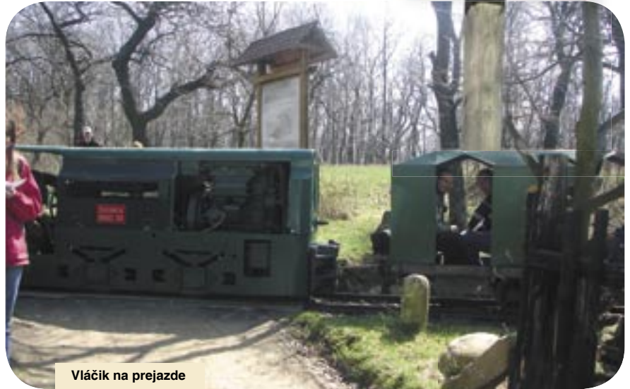
Vlák na prejazde

Otvorenie osobnej a nákladnej dopravy na železničnej trati Trnava – Kúty v roku 1898 umožnilo rýchlejší odvoz výrobkov. Bola postavená aj úzkorozchodná železnica s rozchodom 600 mm medzi závozom v Horných Orešanoch a železničnou stanicou Smolenice. Stavali ju v rokoch 1898 – 1903. Bola predĺžená k pobočnému závodu v Dobrej Vode. Postupne boli pristavané odbočky aj do lesných stredísk. Na veľkom spáde boli prázdne vagóniky vyťahované koňmi do lesa a po naložení boli spúšťané ručne