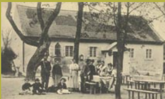
Historické foto Starohájska horárň

dnes už len prázdny výklenok v stene. Ešte pred niekoľkými rokmi tam bola umiestnená drevená socha Panny Márie, ktorú však niekto ukradol. Pod nikou je nápis v nemeckom jazyku, je to spomienka na ničivú povodeň z 5. februára 1850, keď sa na Dunaji vytvorili ľadové bariéry a rieka sa vyliala z koryta.