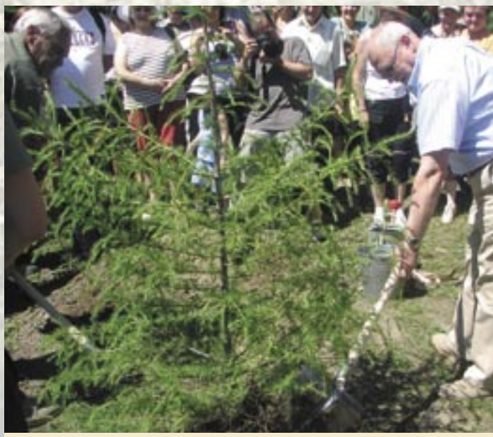
Pri lesníckej kaplnke vysadil pán prezident Ivan Gašparovič tohtoročný Strom roka - smrekovec opadavý