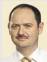
Ing. Zsolt SIMON, Minister pôdohospodárstva, živ. prostredia a reg. rozvoja SR

Etický kódex, súhrn noriem a pravidiel poskytuje rámec