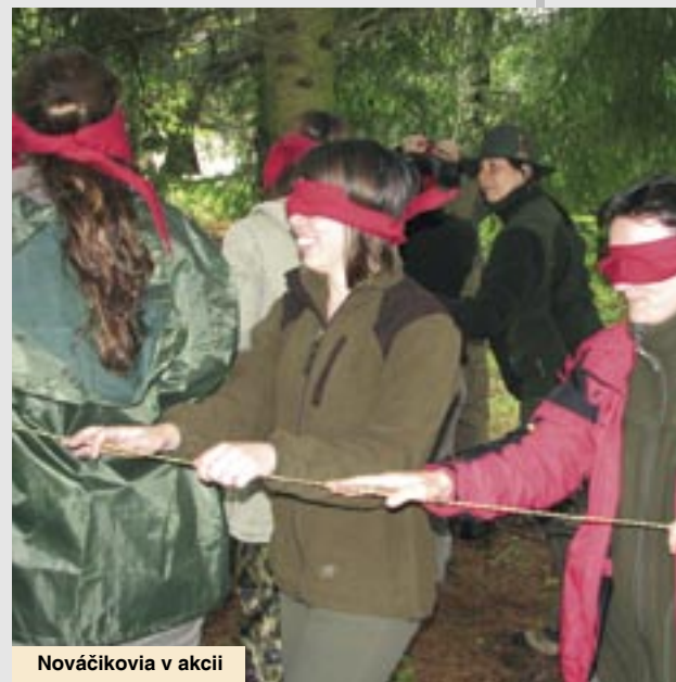
Nováčikovia v akcii

Projekt „Zavádzanie lesnej pedagogiky ako nástroja na zvýšenie konkurencie schopnosti a udržanie pracovných miest v lesnom hospodárstve“ podporený z prostriedkov Programu rozvoja vidieka SR 2007 – 2013, v rámci opatrenia Odborné vzdelávanie a informačné aktivity, umožňuje Národnému lesníckemu centru bezplatný kurz „Lesná pedagogika“ v rokoch 2010 a 2011 celkom pre 60 záujemcov.