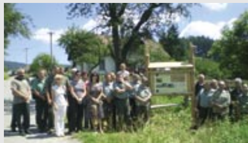
Spoločná fotografia na záver slávnostného osadenia tabule na Kyslinkách