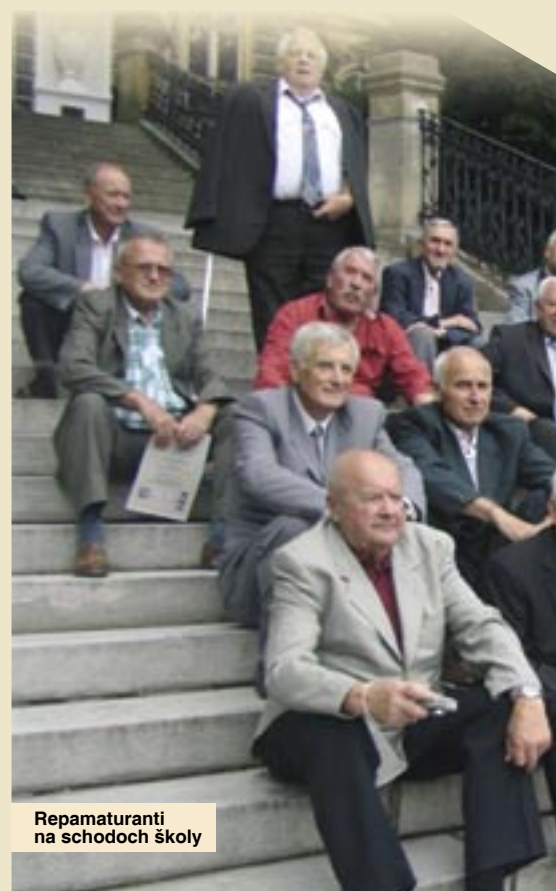
Repamaturanti na schodoch školy