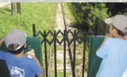
Kúžlo trate očami malých brzdárov