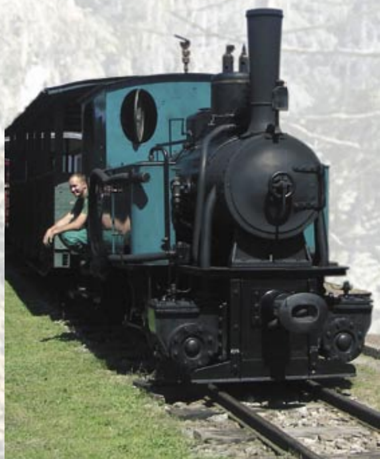
Mašinka úspešne dorazila na Čierny Balog

Aj v tomto roku bol program pripravený a zvládnutý profesionálne. Bol