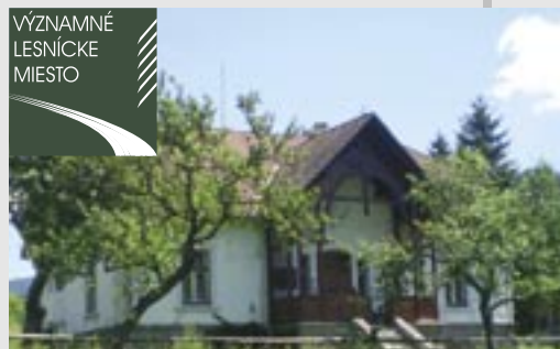
Jedna z najkrajších horárni po nedávnej rekonštrukcii. Dodnes slúži svojmu účelu.