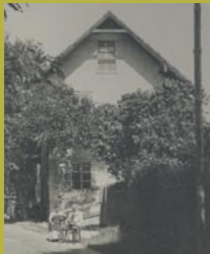
Asanovaná horáreň Pečňa