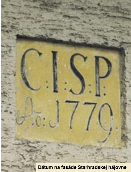
Dátum na fasáde Starhradskej hájovne