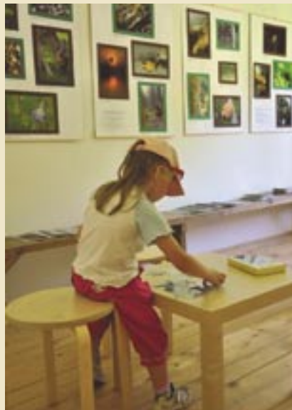
Deti si v rámci výstavy mohli poskladať i skladačku z vystavených fotografií.

Lesy SR, š.p. – Lesnícke a drevárske múzeum Zvolen