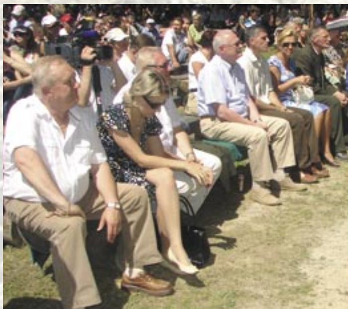
Lesníkov teší každoročná vzácna návšteva - pán prezident SR Ivan Gašparovič