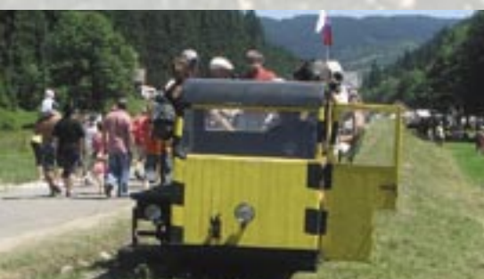
Drezina celý deň vozila malých i veľkých návštevníkov Lesníckeho skanzenu