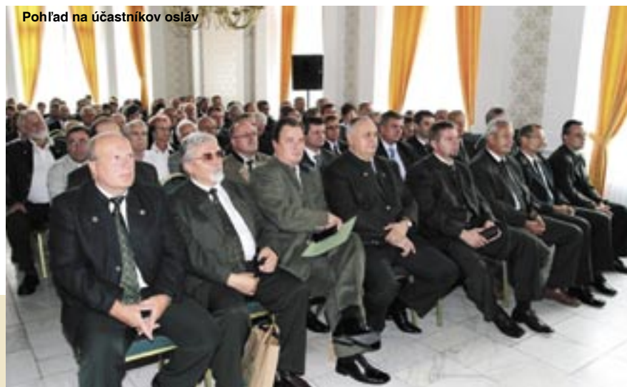
Pohľad na účastníkov osláv