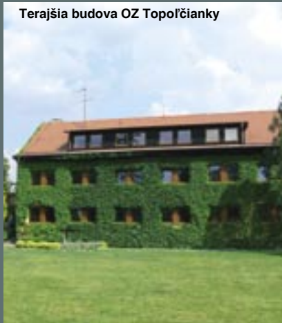
Terajšia budova OZ Topolčianky