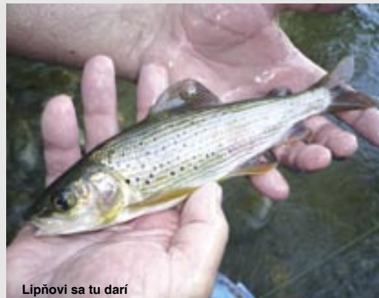
Lipňovi sa tu darí