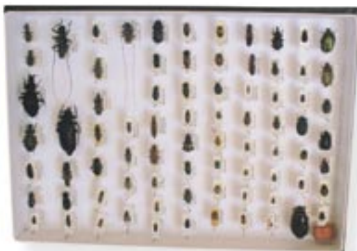
Takto má vyzerat' entomologická zbierka

Tvojom špeciálnym koníčkom je však entomológia ?