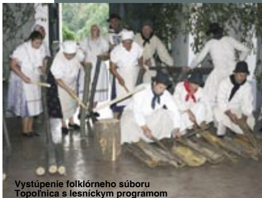
Vystúpenie folklórného súboru Topolčianka s lesníckym programom