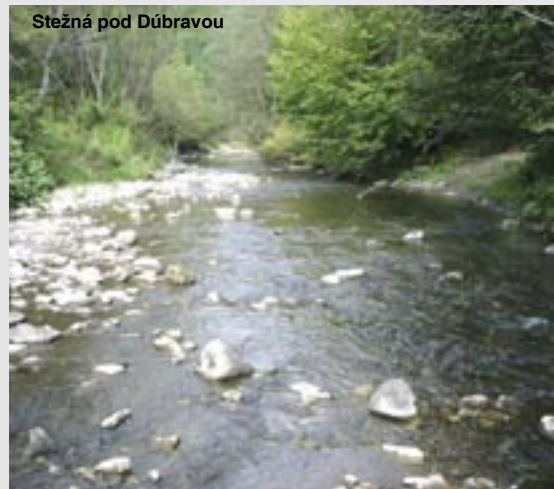
Stežná pod Dúbravou