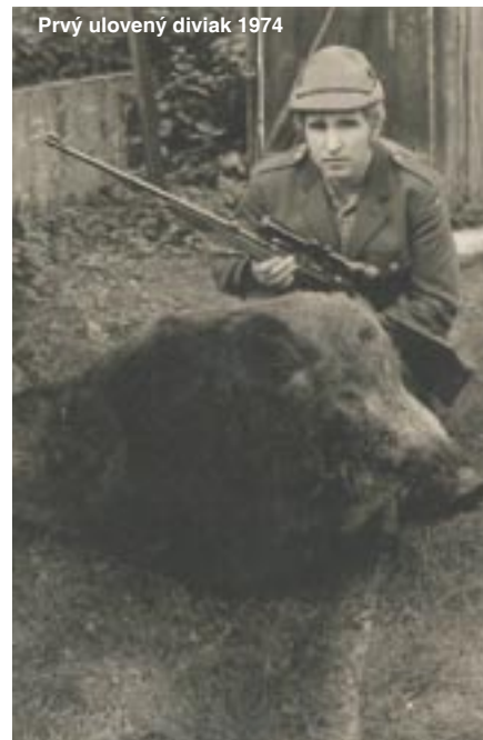
Prvý ulovený diviak 1974

Ďakujem za rozhovor a prajem veľa zaujímavých exponátov do zbierky. ■