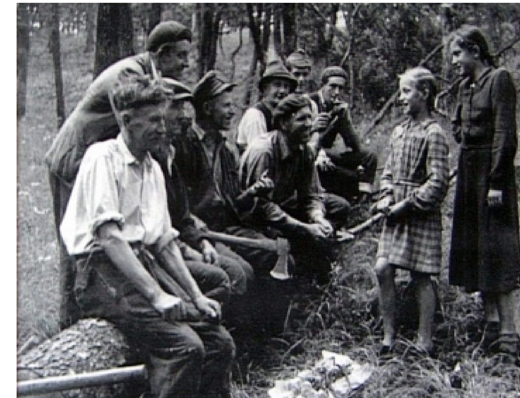
Obedná prestávka pri práci v lese

Huncokári – holzhackeri, (s Holz – drevo, e Hacke – sekera) boli bavorskí a tirolskí drevorubači, ktorí prišli na územie Malých Karpát v polovici 18. storočia s nástupom vlády cisárovnej Márie Terézie (1740–1780). Prvý, písomne doložený krst dieťaťa huncokárov je z roku 1740, čo sa mohlo stať skoro po príchode prvých mladých párov do Malých Karpát. Prvý huncokársky sobáš je zaznamenaný v roku 1853 v Častej a o 10 rokov neskôr aj v Modre. Huncokári postupne osídlili územie až po Myjavu a menšiu časť územia na Považskom Inovci. V oblasti Pezinka boli usadzovaní na Pálfiových majetkoch, hlavne na Cajle, kde mali na majeri Bauwald svoje pezinské centrum. Jednotlivé rodiny žili roztrúsene po horských samotách. Boli to najmä Reisinger (Kollárske), Juriška (v Kučišdorfskej doline) a Rybníček (Föhrenteich), kde ešte v roku 1910 stálo niekoľko huncokárskych domov a mlyn. Horáreň, postavená v roku 1892, stojí dodnes.