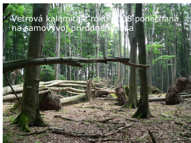
Vetrová kalamita z roku 2008 ponechaná na samovývoj prírodného lesa

Vegetačný kryt tvoria prevažne lesné spoločenstvá 3. – 4. vegetačného stupňa so vzácnym výskytom hrabu. Prevažujú spoločenstvá podzväzu Eu-Fagenion . Lúčne spoločenstvá sú v rezervácii zastúpené minimálne (cca 2% z celkovej plochy územia). Na území NPR Hajdúchy bolo zistených 102 druhov vyšších rastlín. Prevažujú prvky lesnej vegetácie s menším zastúpením lúčnych spoločenstiev. Výskyt jedle a smreka asi nie je pôvodný. (zdroj: S-CHKO Malé Karpaty, http://uzemia.enviroportal.sk )