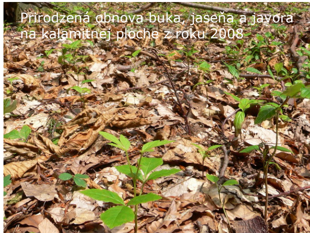
Prírodzená obnova buka, jaseňa a javóra na kalamitnej ploche z roku 2008