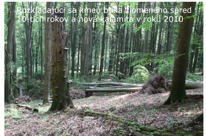
Rozkladajúci sa kmeň buka zlomeného sčred 10-tich rokov a nová kalamita v roku 2010