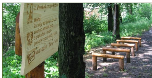
Pohľad na kyslíkovú dráhu