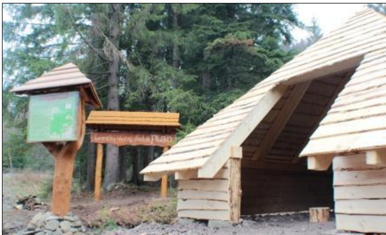
Chodník je dobre vybavený a ponúka „bohom zabudnuté“ scenérie