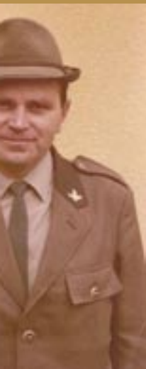
Navštevujem ho s láskou...