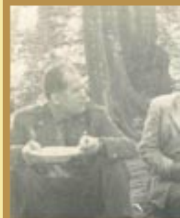
Neskoré zimné zámuto