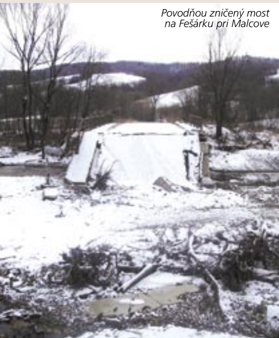
Povodňou zničený most na Fešárku pri Malcove

Každopádne ide o skutočne zaujímavý program, ktorý má hlavu a päťu a veríme, že aj reálnu perspektívu a uplatnenie na Slovensku. Jeho realizácia by pomohla aj nám lesníkom. A nielen preto, že si v ňom môžeme nájsť svoje miesto. ■