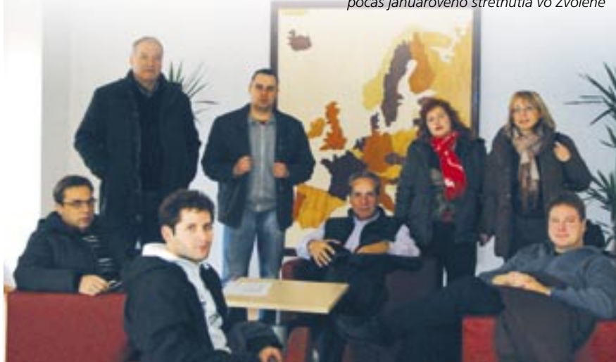
Exkurzia v spoločnosti Bučina DDD, spol. s r.o. počas januárového stretnutia vo Zvolene