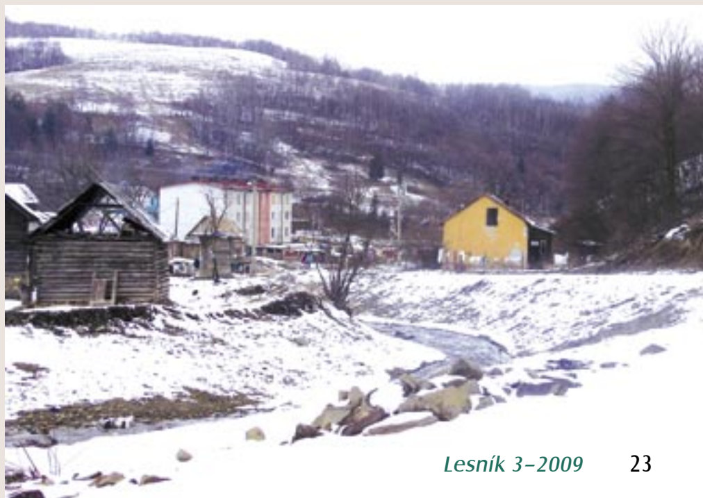
Lesníckmi zregulovaný breh a cesta v Lenartove

Obciam, ktoré márne čakajú na protipovodňové opatrenia štátu, tento projekt ponúka jednoduché a relatívne lacné opatrenia na zachytenie povrchového odtoku skôr, než sa spojí v ničivú ríavu, ktorá sa už ťažko krotí. Najlepšia medzinárodná prax protipovodňovej prevencie spočíva podľa európskych expertov v trojstupňovom prístupe: v zachytení dažďovej vody na mieste kde padá, v jej retencii a až nakoniec v jej odvádzaní. Tento projekt rieši najmä prvé dva kroky protipovodňovej prevencie, ktoré sú u nás neprávom prehliadané a zanedbávané. Znamená posun ťažiska opatrení, ktoré sú v súčasnosti izolované od príčin vzniku povodní, na ich prevenciu. Projekt poskytuje zmysluplnú prácu pre tisíce ľudí v blízkosti ich bydliska, zveľaďuje vodné zdroje a znižuje riziko povodní. Elimináciou príčin vzniku veľkej časti povodní zvýšením vododržnej kapacity územia sa počet, intenzita i dopad povodní výrazne zníži. Má však i ďalšie pozitívne účin-