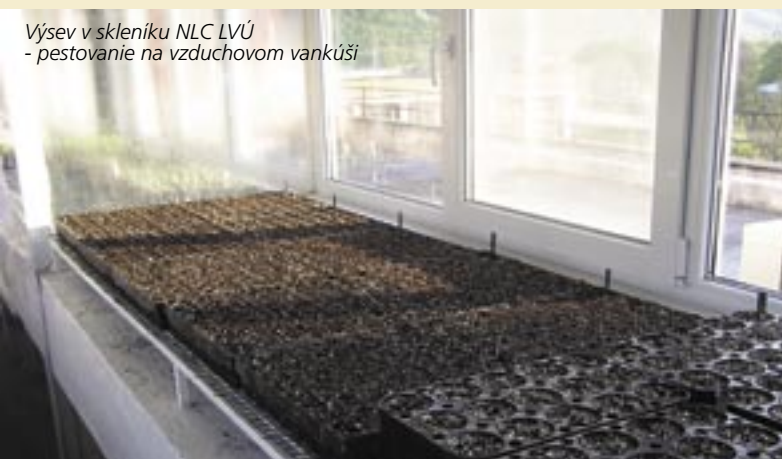
Výsev v skleníku NLC LVÚ - pestovanie na vzduchovom vankúši