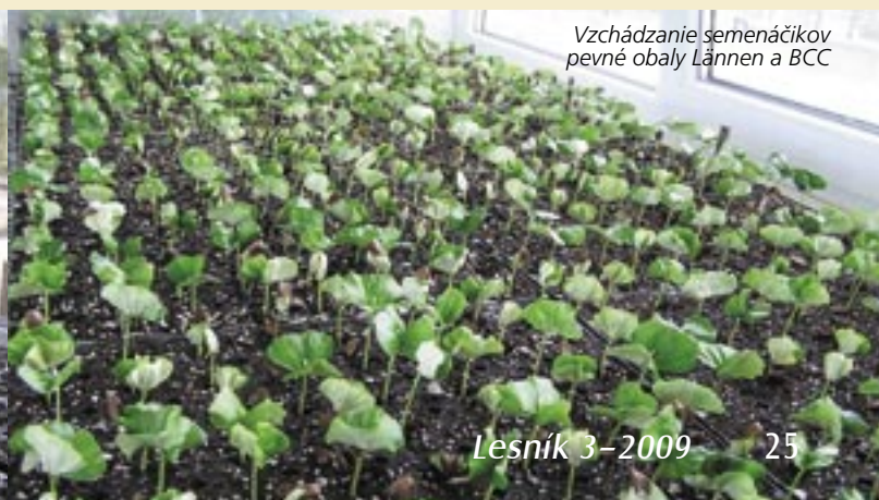
Vzhádzanie semenáčikov pevné obaly Lannen a BCC