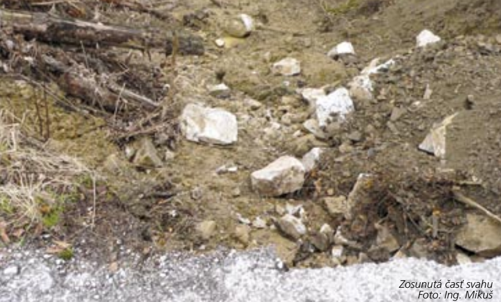
Zosunutá časť svahu

lil sa povrchových odtok v krajine, v dôsledku čoho sa zvýšilo riziko a frekvencia výskytu povodní,