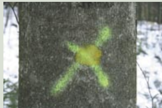
Les vyžaduje premýšľanie...