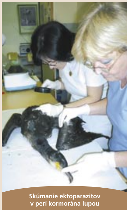
Skúmanie ektoparazitov v perí kormorána lupou

Podujatie ukázalo, že lesnícku históriu možno prezentovať nenáročne a prítlačivo. Úsmevnou bodkou sa stala flaša „mrázovice“, ktorou pamätné miesto pokrstil starosta obce. To, či jej obsah mal naozaj presne deklarovaných 41^{\circ} , účastníci spomienky na udalosť, ktorá do histórie Slovenska vstúpila vďaka lesníkom, nezistovali... ■