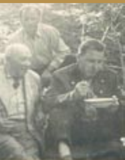
Pod Sninským Kameňom