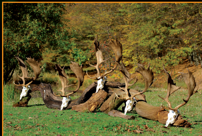
OZ Rimavská Sobota

LESY Slovenskej republiky, štátny podnik Tel.: 048/43 44 135 Generálne riaditeľstvo Mob: 0918 444 135, 0918 334 011 Námestie SNP 8 Fax: 048/43 44 191 975 66 Banská Bystrica E-mail: polovnictvo@lesy.sk