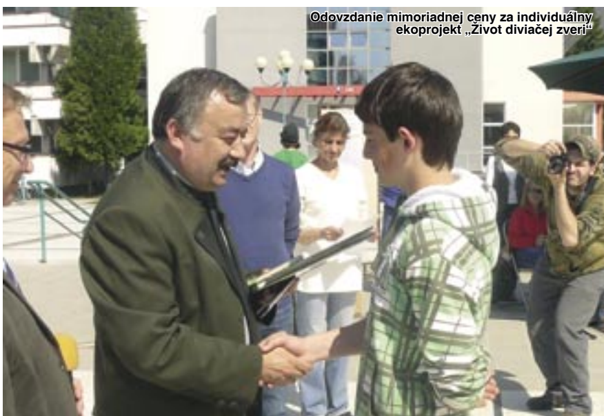
©Dovzdanie mimoriadnej ceny za individuálny ekoprojekt „Život diviacej zveri“