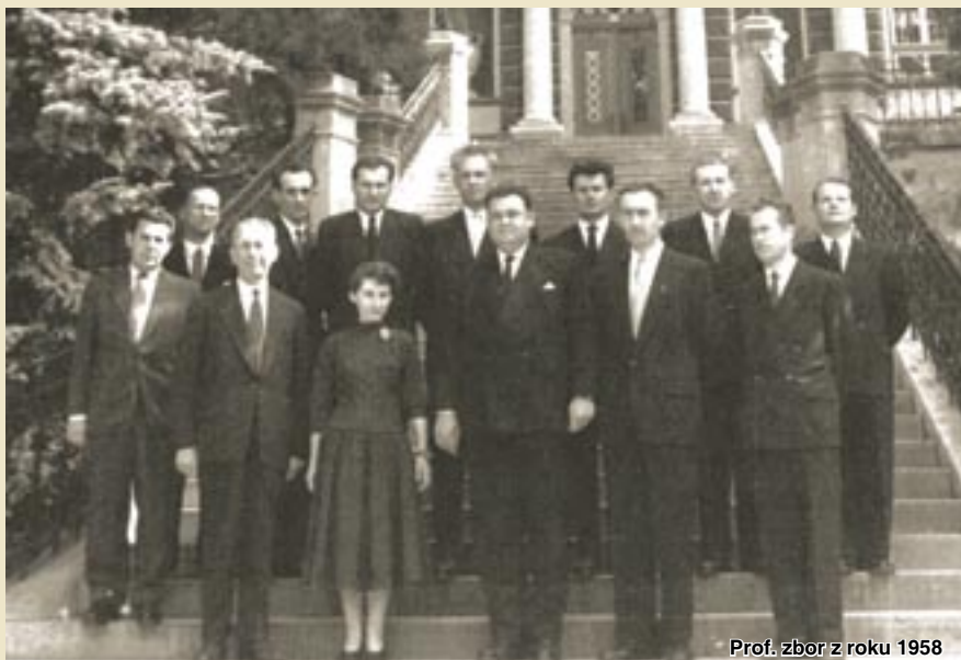
Prof. zbor z roku 1958