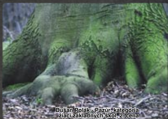
Dušan Polák - Pazúr, kategória žiaci základných škôl, 2. cena