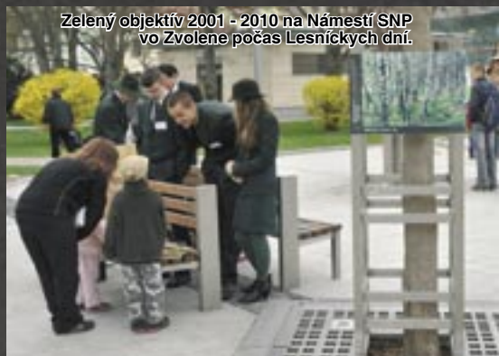
Zelený objektív 2001 - 2010 na Námestí SNP vo Zvolene počas Lesníckych dní.