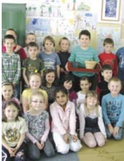
Kresby prváčikov po jarnej vychádzke vo zvernici Karná