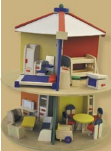
Domček pre bábiky, OZ Inštitút Krista Veľknáza Žakovce