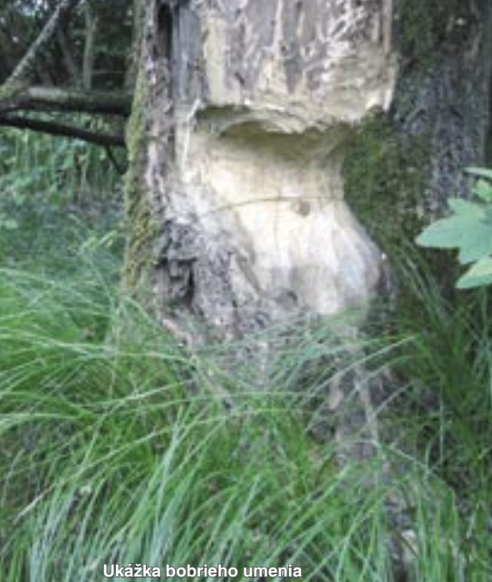
Ukážka bobrieho umenia