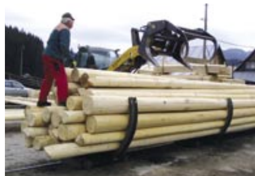
Technika a ľudia pri manipulácii vyrobených stĺpov