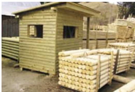
Prípravené palisády na expedíciu, vrátane malej stavby (poľovnícky posed)