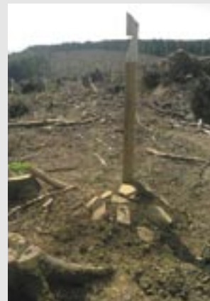
Obnova hraníc medzi JPRL na kalamitných plochách LS Pezinok po vyznačení prístrojom GPS Trimble Geo XM.