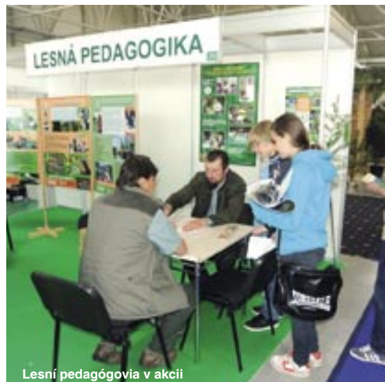
Lesní pedagógovia v akcii

Špeciálna vďaka patrí kolegom, ktorí sa podieľali na výzdobe aj lesným pedagógom. ■