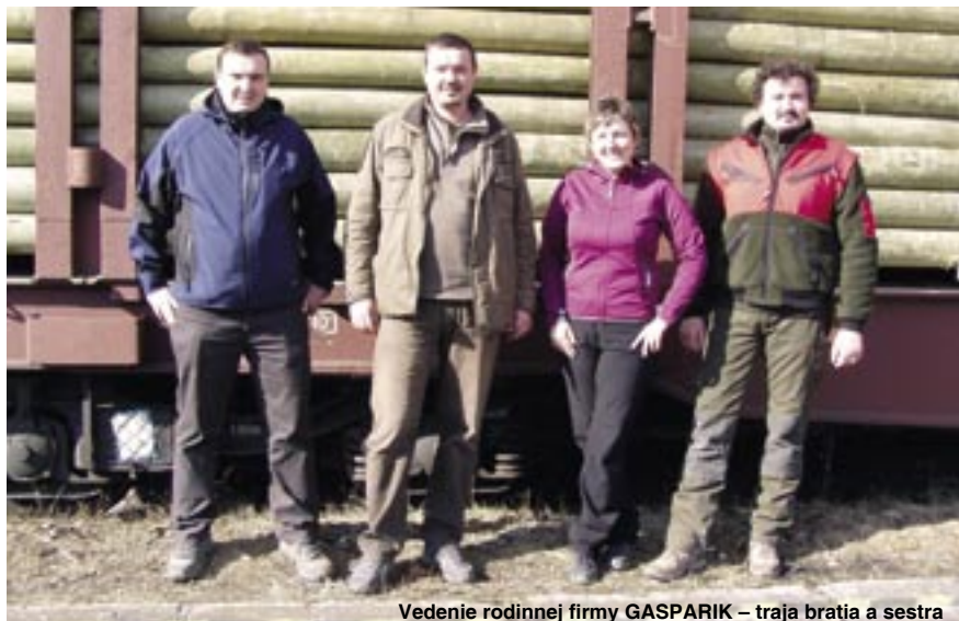
Vedenie rodinnej firmy GASPARIK – traja bratia a sestra

V této rubrice budeme v následujících číslech více méně nepravidelně představovat některých našich odberateľov.