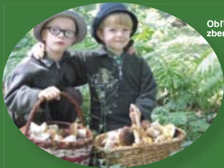
Oblúbený zber húb