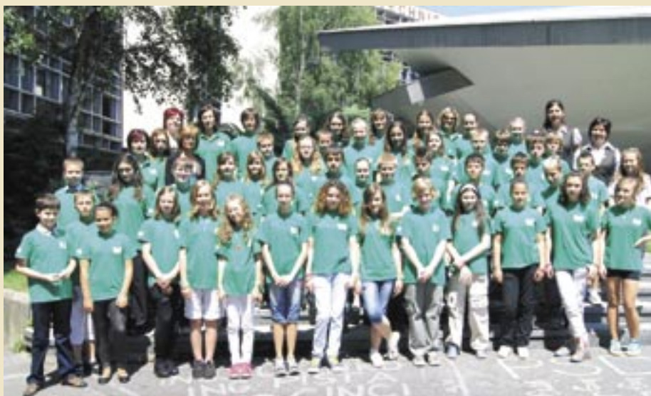
Absolventi prvej Detskej lesníckej univerzity