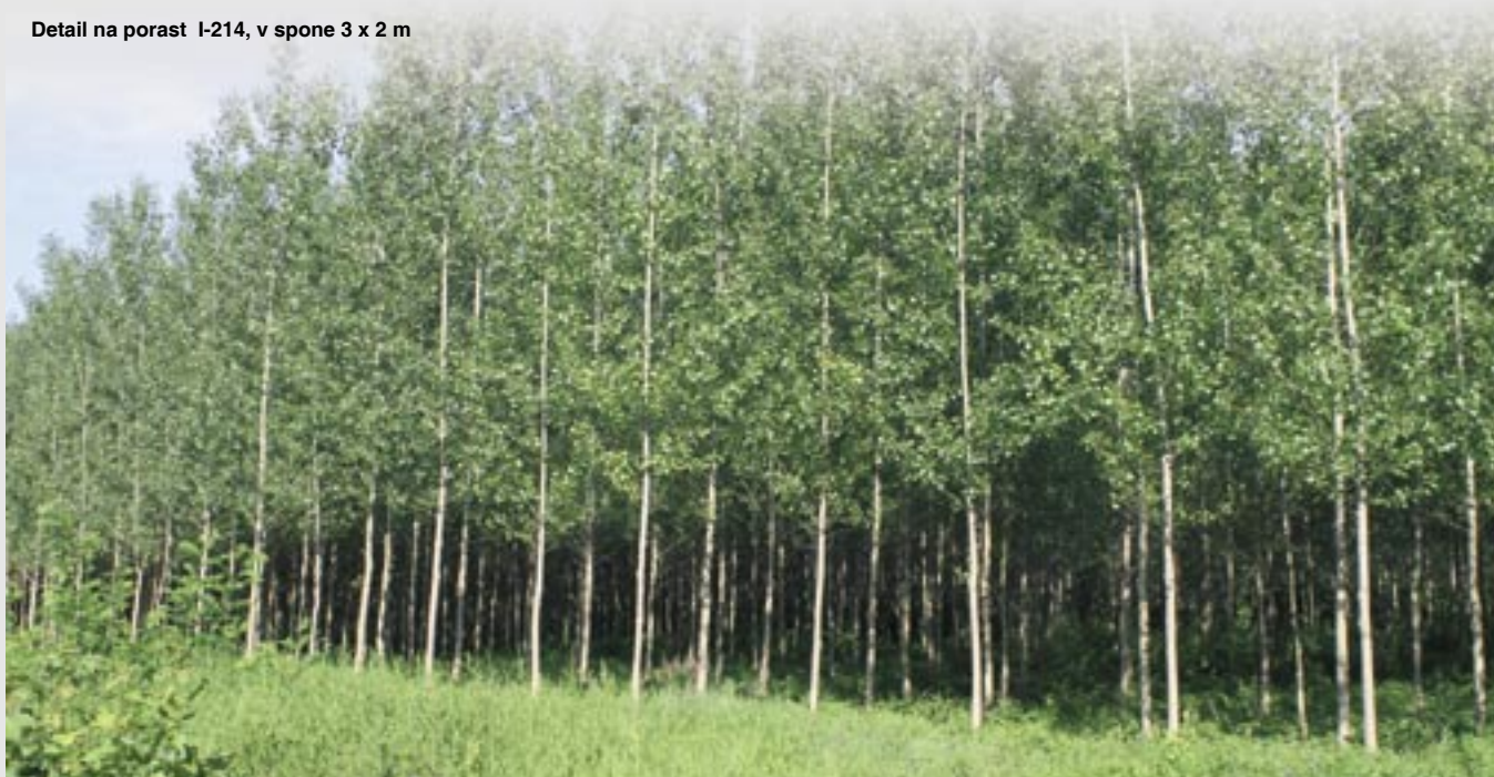
Detail na porast I-214, v sponse 3 x 2 m