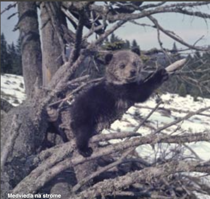
Medvied' na strome

Fotografovať zvieratá vo voľnej prírode je zložitejšie, úplne iné, ako fotiť prírodné scenérie, alebo ľudí. Medvedovi či jeleňovi nevysvetlíte, že má prísť na dohodnuté miesto na určitú hodinu a má