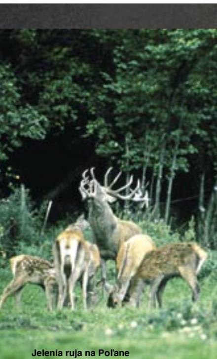
Jelenia ruja na Poľane

Ďakujem za rozhovor, prajem veľa zdravia a ešte mnoho pekných záberov. ■