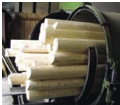
Vkladanie stĺpov do impregnačnej stanice

Urbárske spoločnosti a LESY SR, š.p. dodávajú sortimenty guľatiny: smrek, jedľa, borovica, červený smrek. Po výbere