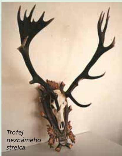
Trofej neznámeho strelca.

sená za Chránenú poľovnú oblasť určenú pre chov a ochranu jelenej zveri na ploche 18.816 ha. Poľovný revír CHPO Poľana bol rozhodnutím MP SR v roku 2002 vyhlásený za vyhradený poľovný revír na ploche 20.659 ha. Jeho obhospodávaním sú poverené LESY SR, š.p., Banská Bystrica prostredníctvom OZ Kriváň a OZ Čierny Balog. Podľa štatútu CHPO Poľana slúži na vzorové poľovnícke obhospodávanie jelenej zveri, ochranu a zachovanie genofondu poľanského jeleňa, zvýšenie chovnej a trofejovej hodnoty, na výskum biológie jelenej zveri a veľkých predátorov a na chytanie jelenej zveri na zazverovanie. Základom chovateľskej práce sú prehliadky jeleních trofejí a zhodov, čo napomáha poznať a cielene udržiavať vhodnú vekovú a pohlavnú štruktúru populácie. Chytená jelenia zver dodaná do nových oblastí, v niektorých revíroch výrazne prispela k zlepšeniu kvality jelenej populácie. Doposiaľ sa v CHPO odchytilo takmer 300 kusov jelenej zveri. Táto zver sa dodala na zazverovanie viacerých poľovných revírov a poľovných oblastí na Slovensku (napr. Topoľčianky, Biela Skala). V Českej republike (napr. Lány, Hluboká, Poněšice). Po vypustení poľanskej jelenej zveri tam do-