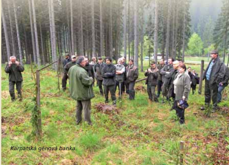
Karpatská génová banka.