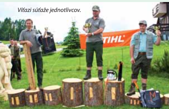
Vítazi súťaže jednotlivcov.