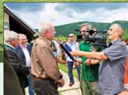
Podujatie podporil aj prezident Ivan Gašparovič a minister Ľubomír Jahnátek