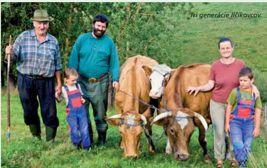
Tri generácie Ilčíkovcov.