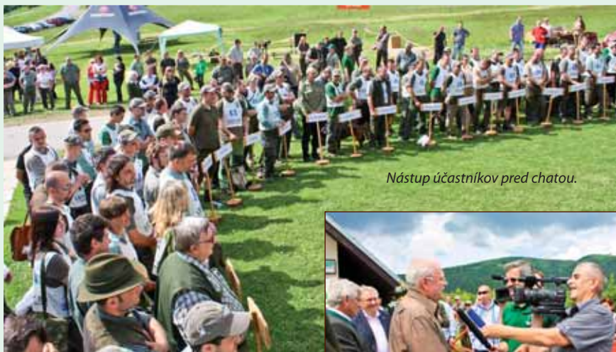
Nástup účastníkov pred chatou.