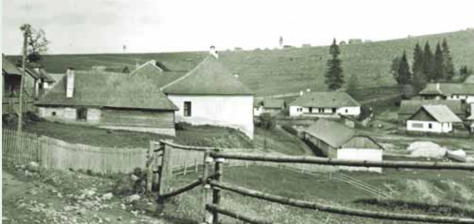
Pohľad z LS na obec Sihla 30. roky 20. storočia.

Lesnícke v Banskej Štiavnici. Štúdiom na „učňovke“ mi zabezpečilo dobrý základ pre ďalšie lesnícke vzdelanie. Získal som vedomosti, ktoré som mohol neskôršie zúročiť v praxi. Zároveň to bola to pre mňa