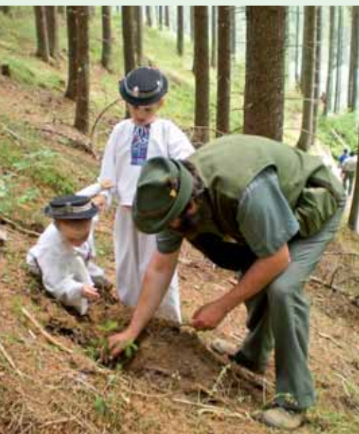
Deti sa učia sadiť les.

Život na dedine je úzko spojený s folklórom. Aj na vysokej škole ma zaujal a prihlásil som sa do Folklórneho súboru Poľana. Prešli sme so súborom kus sveta. Najkrajšie však boli vždy návraty domov. Pri pohľade na našu obec učupenú v lone hôr mi srdce poskočilo od radosti. Vtedy som si uvedomil, aké krásne lesy máme ešte u nás doma.