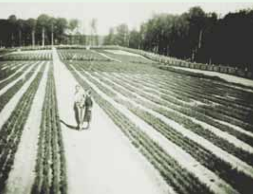
Veľkoškôlka na Jedľovej z obdobia 1. republiky.

aj škola života. Popri štúdiu ma zaujímala história Banskej Štiavnice. Po absolvovaní 4. rokov na lesníckej učňovskej škole ma vzali na TU vo Zvolene.