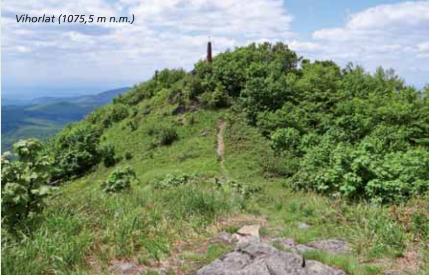
Vihorlat (1075,5 m n.m.)

Vyhasnutá sopka Vihorlat (1075,5 m n.m.) je najvyššou dominantou Zemplína. Je národnou prírodnou rezerváciou s piatym stupňom ochrany a navyše sa nachádza vo Vojenskom obvode Valaškovce. Dlhé roky tam nevedie oficiálne značený turistický chodník. Paradoxne ten neoficiálny je, aj keď pod hrozbou pokút, dobre udržiavaný a riadne vyšliapaný.