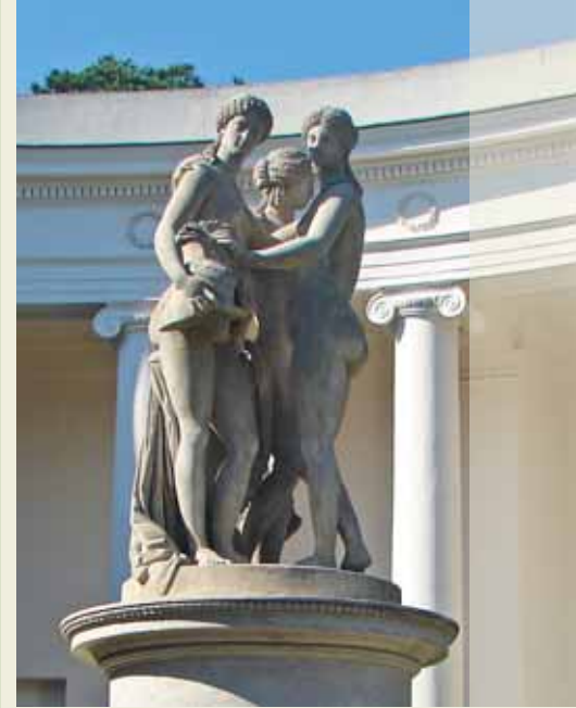
Súsošie: Tři grácie.

Tři Grácie je pôvabné sousoší antických bohyní Athény, Afrodity a Artemis uprostřed kolonády mezi Valticemi a Lednicí na jihu Moravy, kde rád pobýval