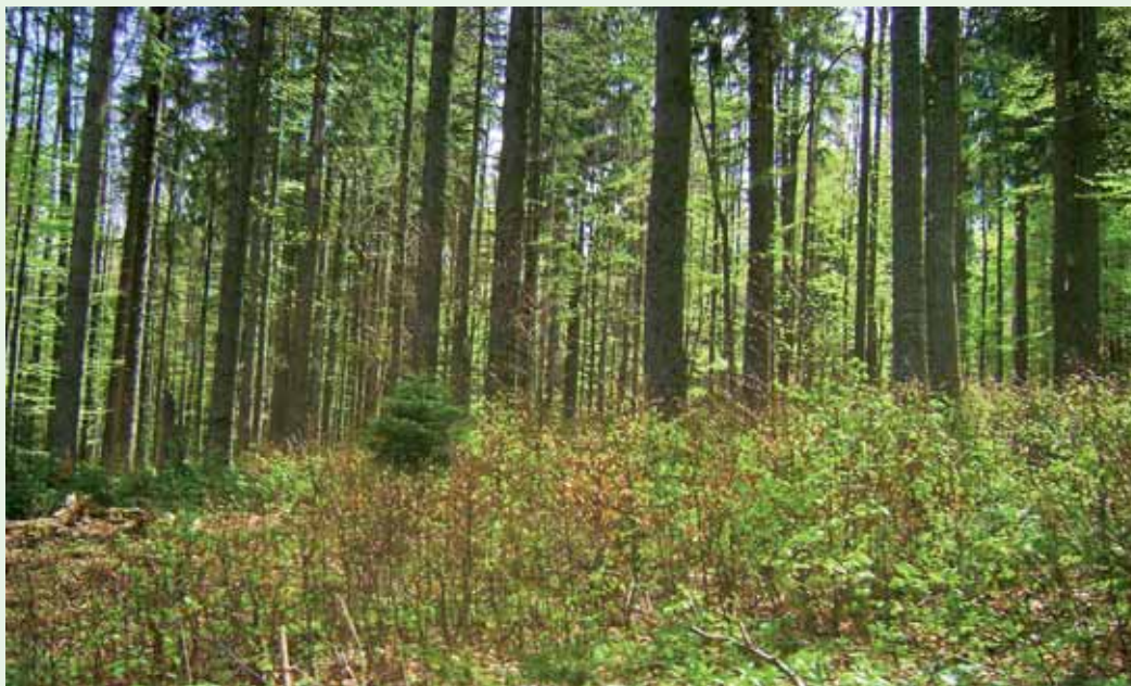
Porasty zaradené do projektu Pro Silva.

Výchova lásky k lesu musí existovať od malička. Deti a les patria k sebe. Najlepšie sa osvedčuje zážitkové učenie. Nielen že ich učím, ale s tými malými čistými deťmi si dobíjam energiu. Na kurze lesnej pedagogiky som sa naučil vnímať aj spätnú väzbu. Deti vám povedia všetko otvore-