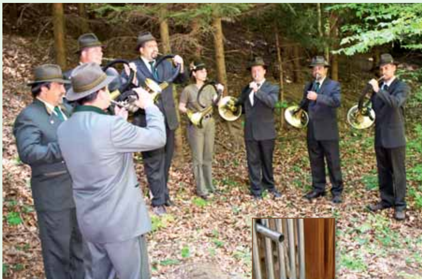
Hraje soubor trubačů Školního lesního podniku Masarykův les Křtiny.