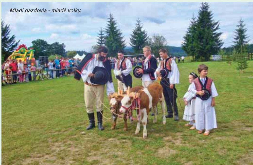
Mladí gazdovia - mladé volky.

ne a bez pretvárok. Vštepujem im lásku ku všetkému živému aj neživému. Učím ich, že aj rozpadajúci strom je pomník stromu a treba sa k nemu správať s úctou. Čím sú deti staršie, tým je to náročnejšie. Najťažšia práca je s dorastajúcou mládežou. Dôležité je nielen vysvetľovať, ale ich vedieť aj zaujať. Napríklad počas akcie Stromy poznania sme pre deti pripravili chodník lesnej pedagogiky. Zapojili sme aj žiakov 8 - 9. ročníka, ktorí spolu s lesníkmi na stanoviskách organizovali lesnú pedagogiku pre svojich mladších spolužiakov.