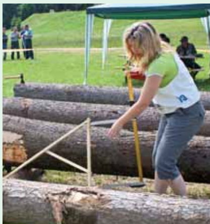
Ozdoba tohoročných súťaží - ženské družstvo z OZ Palárikovo.