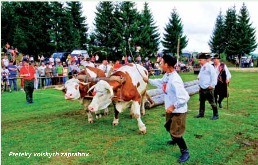
Preteky volských záprahov.