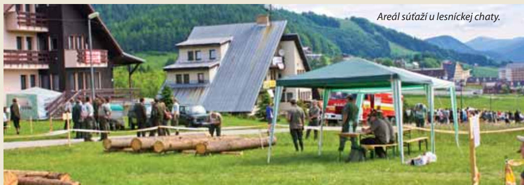
Areál súťaží u lesníckej chaty.

Súťaž už tradične preverila schopnosti a znalosti lesníkov v 12 disciplínach z piatich oblastí – meranie a odhad objemu dreva, ochrana lesa, pestovanie lesa, poľovníctvo a BOZP. Účastníkov čakal napríklad odhad množstva guľatiny, meranie dreva na presnosť, montáž feromónového lapača či sadenie stromčekov a spoznávanie drevín. Ostro sledovaná bola súťaž v hode obojstrannou sekerou na presnosť,