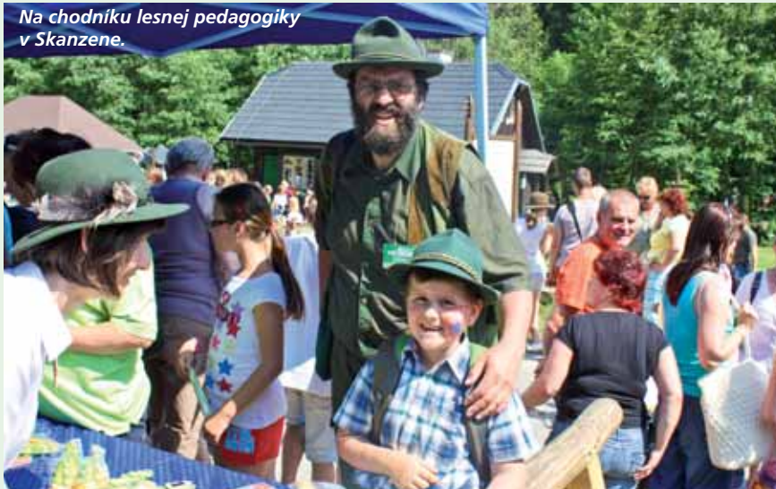
Na chodníku lesnej pedagogiky v Skanzene.

ko sa potom vzdávali svojho majetku. V našej obci bolo JRD založené až v roku 1983. Doma sme mali niekoľko kusov statku a moji predkovia vždy gazdovali. Mne to zostalo podnes ako koníček. Na odvoz a približovanie sme používali volský záprah. Spolu s našim starostom a krčmárom nás napadla myšlienka usporiadať preteky