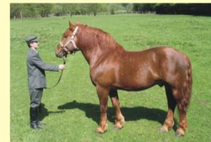
Plemenný žrebec Princ Elmar

Tunajší chov prešiel tromi obdobiami, ktoré nie sú presne časovo ohraničené a navzájom sa prelínajú. V prvom období to bol chov hucula, v druhom období zmohtňovací proces hucula krížením s plemenami fjord, hafling, norik a tretie obdobie je chov norika. Toto obdobie viedlo k vyhláseniu samostatného šľachtiteľského chovu koní plemena norik – norik muránskeho typu . Norik muránsky je kôň ľahko ovládateľný, použiteľný v rôznych oblastiach lesnej prevádzky, poľnohospodárstve a agroturistike. Lesníci z Odštepného závodu LESOV SR v Revúcej a špecialisti na Správe chovu koní so sídlom v Dobšinej tak svojou prácou, neraz ocenenou aj na medzinárodnej úrovni, prispievajú k udržaniu nielen nevyhnutného pomocníka pre svoju prácu, ale aj živej pamiatky tunajšieho nádherného kraja.