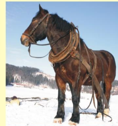
Norik pri práci