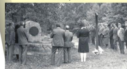
Otvorenie obnoveného Pamätného miesta (1987)