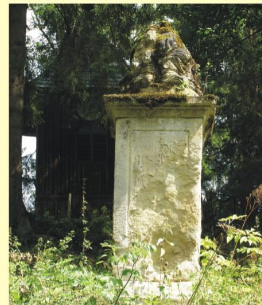
Stĺp pred rekonštrukciou Column before the restoration

The memorial column was restored in 2008 by the Forests of the Slovak Republic, s.e. Banská Bystrica. The column is a protected artefact within the Special Forestry Site Čierny Váh.