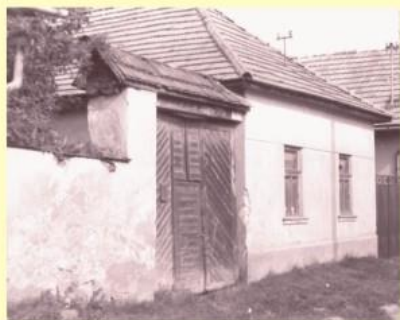
Dom na Boryho ulici (dnešná Horná ulica 16/236), kde R. Geschwind býval i zomrel.

Rudolf Geschwind je pochovaný na miestnom cintoríne.