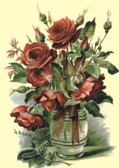
Pozdrav Tepličiam - najslávnejšia z ruží