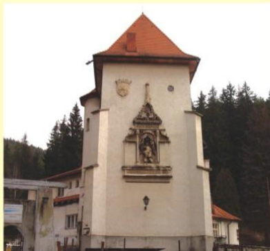
Rodný dom v Kráľovej Lehote (súčasný stav). Birthplace in Kráľova Lehota (present picture)

Our Mother. Grand Prix from World Exhibition Paris, 1900 (on display with The Thinker by A. Rodin)