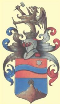
Erb A. Stróbla s textom: Erb A. Stróbla, ktorého cisár v roku 1913 povýšil do šachtického stavu. Coat of Arms of A. Stróbl with the wording: Coat of Arms of A. Stróbl (knighted by the Emperor Franz Joseph I of Austria in 1913)