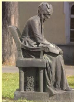
Naša matka. Grand prix Svetová výstava v Paríži 1900 (spolu s dielom A. Rodina Mysliteľ)

Sculptor of European recognition Alojz Stróbl, native to Kráľova Lehota in Slovakia, learnt the trade in Liptovský Hrádok, Levoča, Třinec and Vienna. Throughout his rich and eventful career as a sculptor he never failed to draw inspiration from his youth years spent in Liptov. His exceptional talent did not go unobserved to the Emperor Franz Joseph I of Austria who commissioned him to complete his own portrait sculpture for the Budapest Opera House. In 1881, he moved to Budapest to work as a professor and later the director of sculpture academy. In 1893, he bought his birthplace in Kráľova Lehota which he later redesigned and reconstructed to house his studio. The studio saw one of his best works gaining fine contours, including impressive Our Mother sculpture (1896) which is still on display in the house's front yard and is now seen as the monument of the artist's creative talent. Alojz Stróbl spent majority of his life in Budapest where he is also buried. His grave is symbolically covered by a granite slab from the Liptov village of Vyšná Boca. Out of the total number of over 600 works of art, only few are now on display in Slovakia. Three of them - The Dying Stag (1897), The Wounded Wild Boar and the Hunting Dog (1902), and The Bear and the Mouflon, (1909), all the property of the Forests of the Slovak Republic, state enterprise, are to the delight of its visitors exhibited in Topolčianky Park.