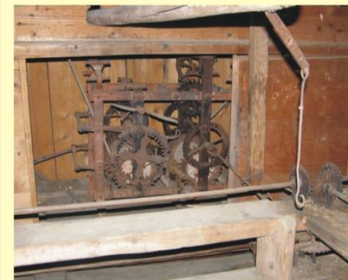
Hodinový stroj Clock mechanism

Uvedené objekty sú národnou kultúrnou pamiatkou vo vlastníctve podniku LESY SR, š.p., Banská Bystrica, ktorý túto lokalitu zaradil v roku 2007 medzi "Významné lesnícke miesta".