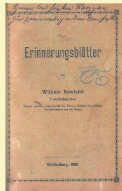
Titulná strana Rowlandovej publikácie Spomienkové listy z roku 1886 Titulná strana Rowlandovej publikácie Spomienkové listy z roku 1886