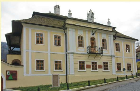
Budova prefektúry – sídlo Oravského kompososorátu v Oravskom Podzámku s pamätou tabuľou Wiliama Rowlanda a posledným Rowlandovým kameňom odhaleným v roku 2008, autor fotografie E. Genserek Budova prefektúry – sídlo Oravského kompososorátu v Oravskom Podzámku s pamätou tabuľou Wiliama Rowlanda a posledným Rowlandovým kameňom odhaleným v roku 2008, autor fotografie E. Genserek

Obrazový materiál poskytlo Oravské múzeum P. O. Hviezdoslava v Dolnom Kubíne. Za cenné rady a informácie patrí poďakovanie RNDr. Ofge Removčíkovej a RNDr. Jaroslavovi Kocianovi.