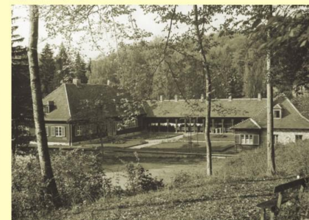
Antonstál v r. 1949 Antonstál, 1949