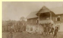
Poľovačka, Antonstál, 1899 After the hunt, Antonstál, 1899