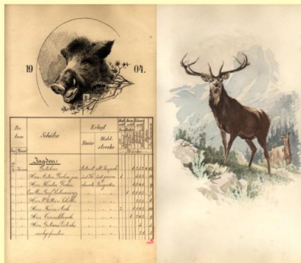
Z Antonsthálskych kroník, 1897 - 1937 From Antonsthál Chronicles, 1897 - 1937