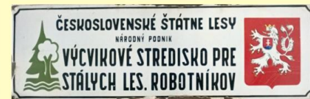
Tabuľa z druhej polovice 20. storočia, Antonstál Board from the second half of the 20th century, Antonstál