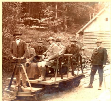
Lesná železnica z Ľuborče do Antonstálu, 1911. Železnica bola využívaná najmä na dopravu dreva, ale zároveň spájala Antonstál s Ľuborčou. Forest railway from Ľuborča to Antonstál, 1911. The railway was primarily used to transport wood, but also formed a transportation link between Antonstál and Ľuborča.