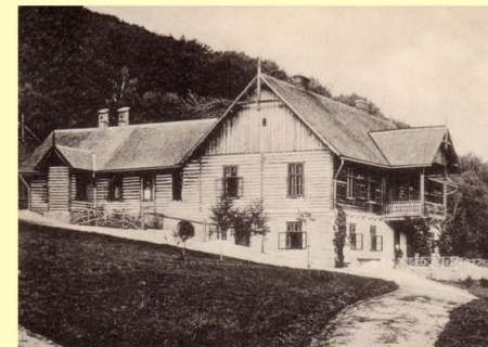
Pôvodný poľovnícky zámok Antonstál, 1900 Original hunting lodge Antonstál, 1900

V päťdesiatych rokoch 20. storočia, po konfiškácii zámku československými štátom, tu bola umiestnená lesnícka učňovská škola a trvalejšie stredisko pre drevorubačov. Antonstál prešiel viacerými stavebnými úpravami a dnes je v správe štátneho podniku LESY Slovenskej republiky, Odštepny závod Trenčín.