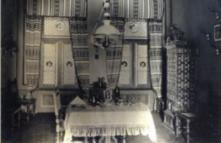
Interiér zámčoka / Castle interior / A Vadászkastély berendezése.