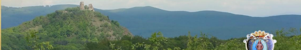
Panorama Forgáčových lesov v okolí hradu Slanec, na ktorom gróf Forgáč zriadil rodové múzeum Panoramic view of Forgach's forests of Slanec castle in which Count Forgach founded the family museum A Forgach birtok erdői panorámá a Szaláncai vár környékén, amiben Forgáč gróf család múzeumot rendezett

Postoj pútník, toto miesto dýcha históriou... Rozvaliny pred sebou sú smutným zvyškom krásneho zámčoka, ktorý tu dal v 19. storočí vybudovať gróf Štefan Forgáč (1854 – 1916), príslušník významného uhorského rodu. Neďaleko odtiaľto je aj torzo jeho hrobky.