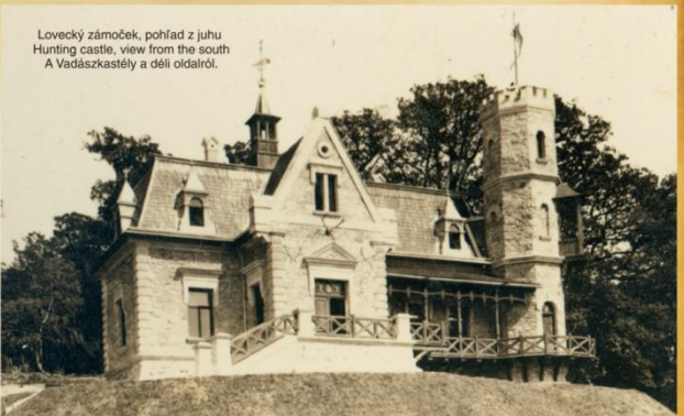
Lovecký zámček, pohľad z juhu Hunting castle, view from the south A Vadászkastély a déli oldalról.