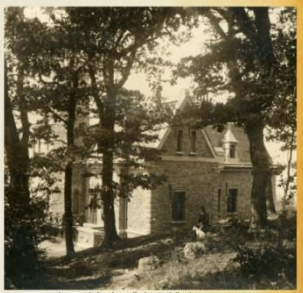
Lovecký zámček, pohľad zo severu Hunting castle, view from the north A Vadászkastély az északi oldalról