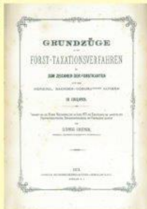
Základy taxáčnych prác a kreslenia lesných máp, dielo Ľudovíta Greinera, 1873 Základy taxáčnych prác a kreslenia lesných máp, dielo Ľudovíta Greinera, 1873