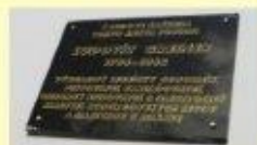
Pamätná tabuľa Ľudovíta Greinera na budove radnice v Jelšave Pamätná tabuľa Ľudovíta Greinera na budove radnice v Jelšave