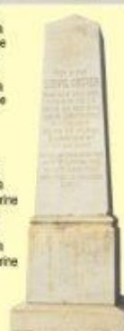
Náhrobný kameň na hrobe Ľudovíta Greinera na cintoríne v Jelšave Náhrobný kameň na hrobe Ľudovíta Greinera na cintoríne v Jelšave

Z úcty k histórii a pre pamäť budúcich generácií vyhlásil tieto lokality štátny podnik LESY Slovenskej republiky za VÝZNAMNÉ LESNÍCKE MIESTO. Odborným garantom vyhlasovania, evidencie a zachovávanía významných lesníckych miest na Slovensku je Lesnícke a drevárske múzeum vo Zvolene.