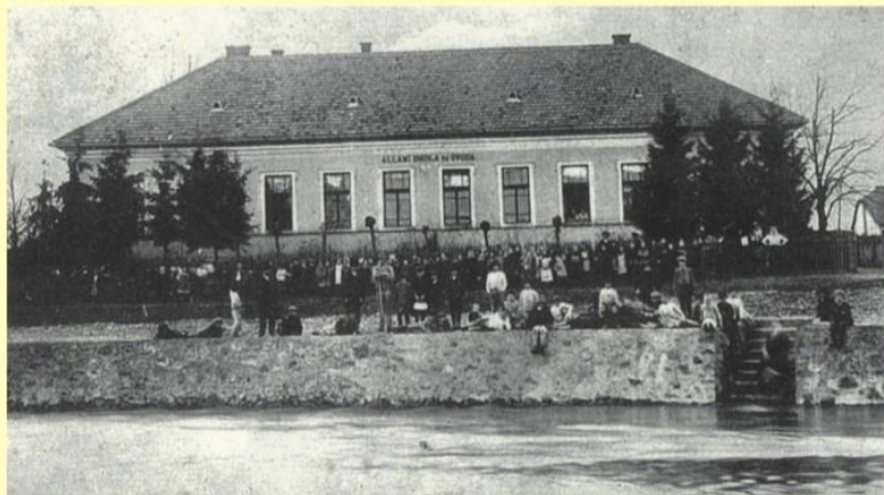
Rodný dom v roku 1919 Native house from 1919

Nech dielo profesora Stolinu vždy nachádza zdatných nasledovníkov!