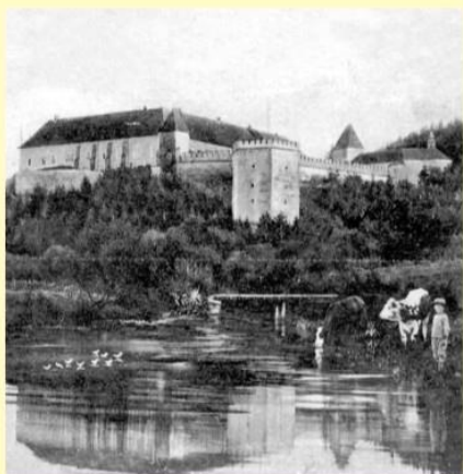
Správa štátnych lesov sídlila na Vígľašskom zámku Vígľaš Castle - the seat of the State Forests Authority

V pamätný deň bola o 7,00 hod. nameraná na zrážkomernej stanici tunajšieho drevoskladu teplota - 38,2°C. Išlo o pracovisko Správy štátnych lesov Vígľaš, ktorá bola súčasťou Riaditeľstva štátnych lesov a majetkov v Žarnovici patriacemu k významnému podniku Československé štátne lesy a majetky. K žarnovickému riaditeľstvu patrila aj neďaleká Správa štátnych majetkov Vígľaš - Pstruša, kde bola na meteorologickej stanici v rovnakom čase nameraná teplota -38,0°C. Na tejto stanici sa však nachádzal aj tzv. minimálny teplomer, ktorý v ranných hodinách zaznamenal absolútny slovenský mrazový rekord - 41,0°C. Extrémna zima 1928 - 29 nebola charakteristická len rekordným mrazom, ale predovšetkým dlhodobým trvaním nízkych teplôt, ktoré spôsobili rozsiahle poškodenie lesných porastov.