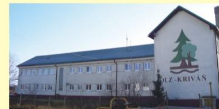
Budova Odštepného závodu LESOV SR v Kriváňi, ktorý túto lokalitu zriadil a udržiava The building of the Forest Enterprise Kriváň, the founder and manager of the site