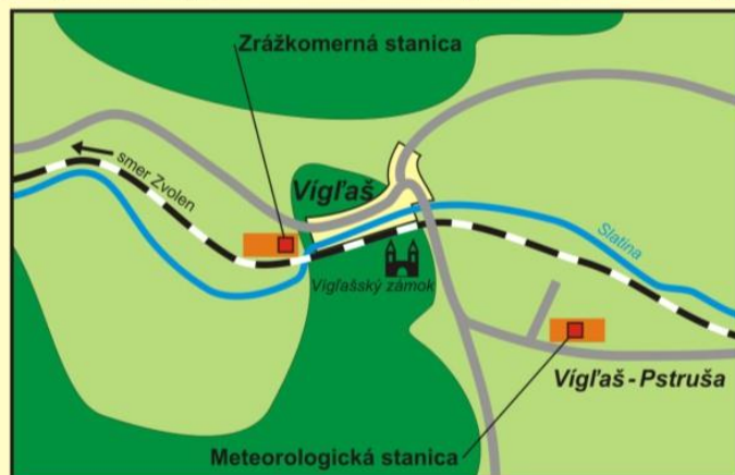
Nákres umiestnenia staníc Plan of the stations location