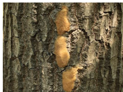
Obrázok 3: Vaječné znášky mnišky veľkohlavej na kmeňoch dubov