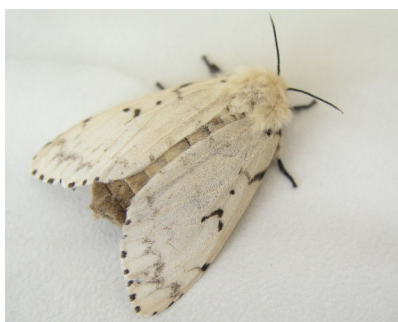
Obrázok 1: Mniška veľkohlavá, samec (hore) a samica (dole)