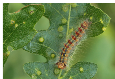
Obrázok 2: Húsenice po vyliahnutí niekoľko dní ostávajú na znáške až potom sa rozliezajú do okolia (hore), dospelá húsenica je pestro sfarbená, chlpatá (dole)