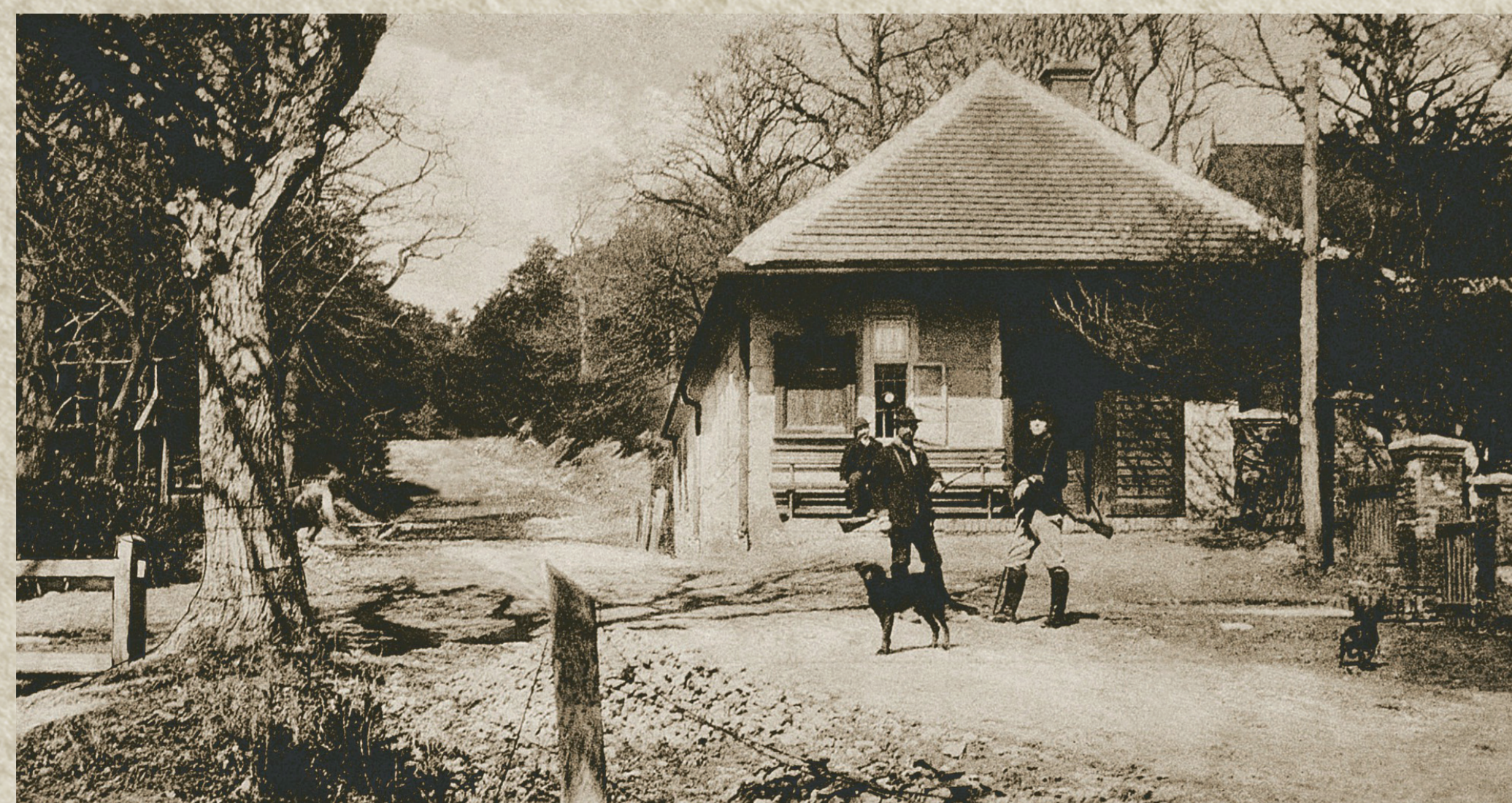
Lesný úrad v Harmónii stál pri lesnej ceste do Kuchyňa na Záhorie. | The forestry office in Harmonia was situated by the road to Kuchyňa in Záhorie region.