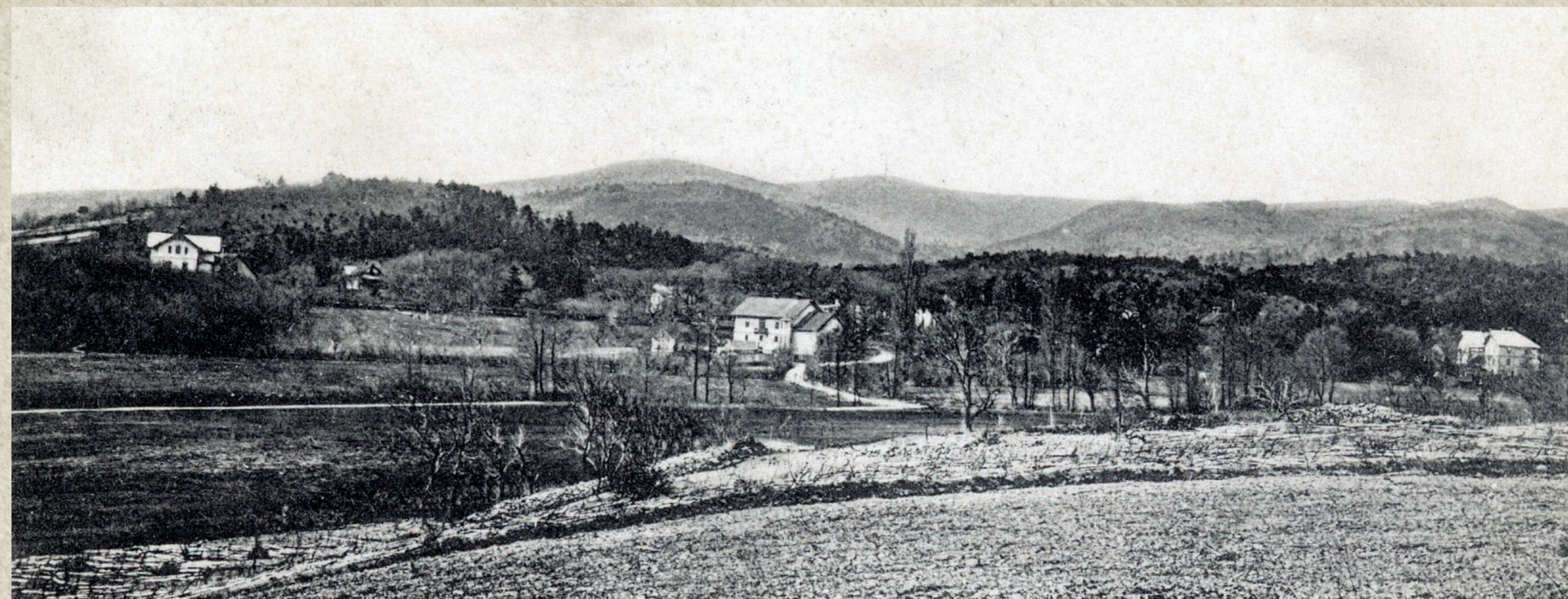
Pohľad na letovisko od Veštíkovej horárne. | The view of the resort Harmonia from the Veštíkova game keeper's lodge.