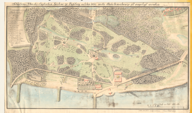
Po ústupe lužných lesov a postupnom zaniknutí ramien Dunaja boli v Petržalke vybudované nádherné parky a sady. Mapa petržalského parku z r. 1832, dnes Sad Janka Kráľa.