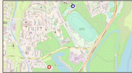
Miesto, na ktorom sa nachádzate. ● You are here. ● Navštívte aj objekt zachovanej hájovne na Starohájskej ceste č. 5. ● We recommend a visit of gamekeepers' lodge in 5 Starohájska Road, too. ●