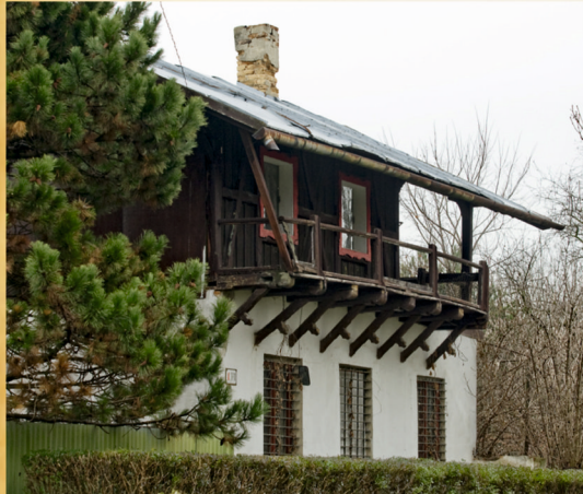
Jagdhaus - poľovní dom Jagdhaus - hunting house