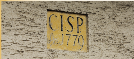
Letopočet na fasáde horárne The date on a facade of the gamekeepers' lodge