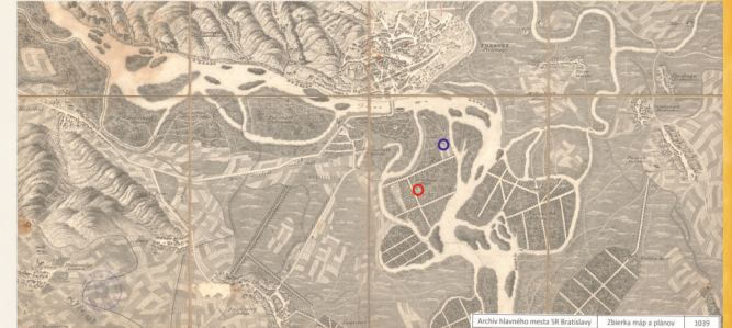
Panoramatické zobrazenie Petržalky a parku v polovici 19. storočia, na ktorom sú vyznačené horárne a označená je aj horárneň na dnešnej Starhradskej ulici. ● A panoramic view of Petržalka and park in the 19th century with the marking of the gamekeepers' lodges. You can see mark of the gamekeepers' lodge in Starhradská Street. ●