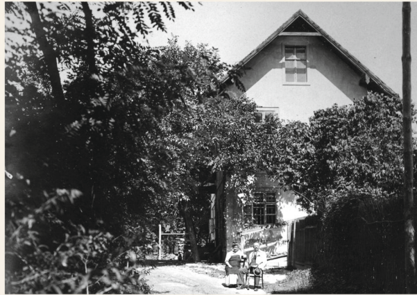
Jedna z ďalších horární stála v Pečni. Zanikla po vzniku pohraničného pásma. Z bývalého panstva stoja ešte horárne na Klokočovej ul. v Petržalke a vo Wolfsthal, dnes už na území Rakúska. Another gamekeepers' lodge was in Pečňa. It was destroyed when the border zone was formed. Until now still exist the gamekeepers' lodges in Klokočova Street in Petržalka and in Wolfsthal in Austria.