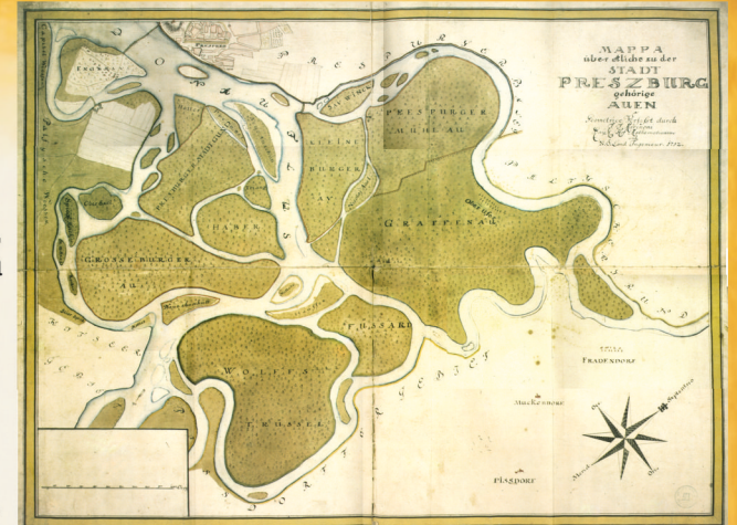
Ramená Dunaja a lužné lesy na území Petržalky na mape z 18. storočia The branches of the River Danube and the floodplain forests in the area of Petržalka in the 18th century.