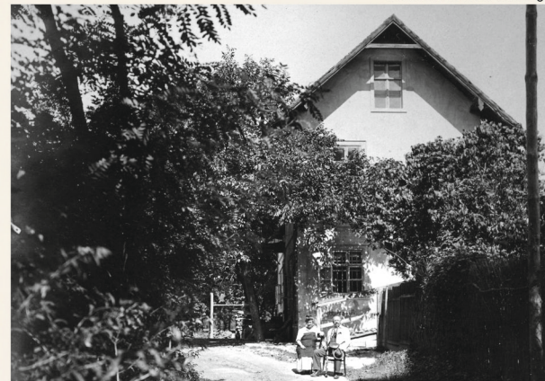
Jedna z ďalších horární stála v Pečni. Zanikla po vzniku pohraničného pásma. Z bývalého panstva staja ešte horárne na Klokočovej ul. v Petržalke a vo Wolfsthalte, dnes už na území Rakúska. Another gamekeepers' lodge was in Pečňa. It was destroyed when the border zone was formed. Until now still exist the gamekeepers' lodges in Klokočova Street in Petržalka and in Wolfsthalte in Austria.