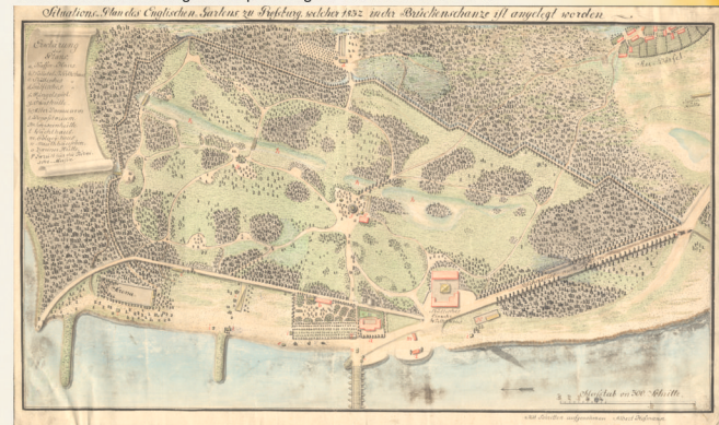
Po ústupe lužných lesov a postupnom zaniknutí ramien Dunaja boli v Petržalke vybudované nádherné parky a sady. Mapa petržalského parku z r. 1832, dnes Sad Janka Kráľa. After the floodplain forests deforestation and the gradual disappearing of the branches of the River Danube in Petržalka were beautiful parks and gardens established. The map of the park in Petržalka in 1832, now called „Sad Janka Kráľa“.

Hájovňu na znak úcty k histórii a na pamäť budúcim generáciám vyhlásil štátny podnik LESY Slovenskej republiky v roku 2020 za VÝZNAMNÉ LESNÍCKE MIESTO. Garantom vyhľadávania, evidovania, obnovy a popularizácie významných lesníckych miest je Lesnícke a drevárske múzeum vo Zvolene.