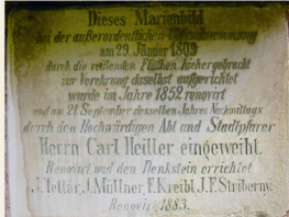
Detail textu / Detail of the text