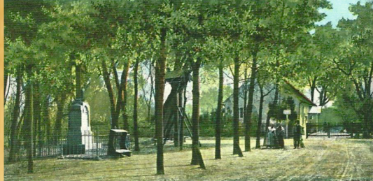
Pozsony — Pressburg. Vadászház — Jägerhaus. Partie aus der alten Au.