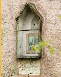
Výklenok, v ktorom bola socha Panny Márie. A niche in which used to be statue of Virgin Mary.

Dobový pohľad na bývalú horárňu a kamenný kríž, ktorý bol neskôr premiestnený do neďalekej kaplnky, postavenej v roku 1909. Historical view of the former gamekeepers' lodge and the stone cross which was later moved to the chapel built in 1909.