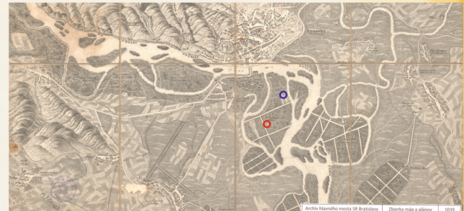
Panoramatické zobrazenie Petržalky a parku v polovici 19. storočia, na ktorom sú vyznačené horárne a označená je aj horárňu na dnešnej Starohájskej ceste. A panoramic view of Petržalka and park in the 19th century with the marking of the gamekeepers' lodges. You can see mark of the gamekeepers' lodge in Starhradská Street.