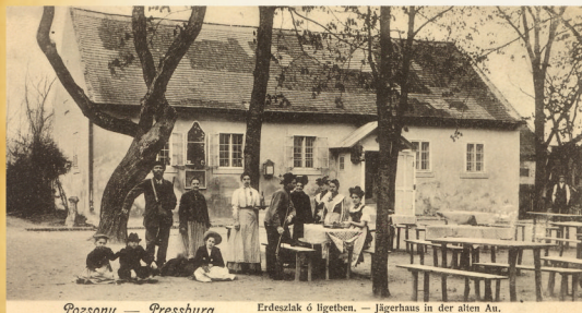
Pôvodná podoba horárne Picture of the gamekeepers' lodge in the past