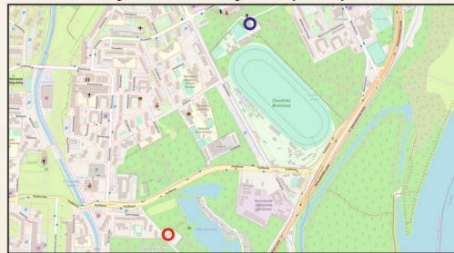
Miesto, na ktorom sa nachádzate. You are here. Navštívte aj objekt zachovanej hájovne na Starhradskej ulici č. 5. We recommend a visit of gamekeepers' lodge in 5 Starhradská Street, too.

Horárňu na Starohájskej ceste z 19. storočia bola známa aj pod menom Kokešova horárňu. V jej priecheli sa nachádza výklenok, kde bola umiestnená socha Panny Márie. Pod ním umiestnený nemecký nápis prezrádza, že ide o pripomienku povodne z 29. januára 1809, obnovenú v roku 1852. O niečo nižšie sa nachádza malá tabuľka s ryskou, dokumentujúca stav vody z inej povodne 5. februára 1850. História zaznamenala, že v istom období bol v horárni vyhľadávaný Hostinec u Hubera, známy vynikajúcou kuchyňou.