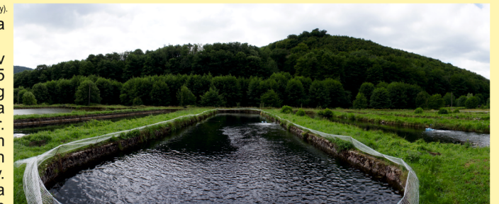
Dolné rybníky vybudované v roku 1962. V prípade potreby ich zamestnanci rybárne ohrádzajú sieťami na ochranu rýb pred volávkami. Lower fishponds built in 1962. If needed, employees of the Fish Farm enclose them with nets to protect the fish from the herons.

LESY Slovenskej republiky, štátny podnik, zachovávajúcu úctu k minulosti, vyhlásili v roku 2022 Rybáreň Parina za významné lesnícke miesto. Odborným garantom vyhlasovania, evidencie a zachovávanie významných lesníckych miest na Slovensku je Lesnícke a drevárske múzeum vo Zvolene.