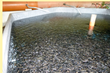
Odchov plôdika v novej rozkrmovni so stálym prítokom vody, ktorá bola postavená v roku 2012. Rearing of small fry in a new feeding shop with a stable water flow, built in 2012.

Rybáreň Parina je studenodvorné rybné hospodárstvo. Pôvodnou chovnou rybou bol pstruh potochý, no od prelomu 19. a 20. storočia ho postupne začal nahrádzať pstruh dúhový z tichomorského pobrežia Severnej Ameriky a Ázie, ktorý lepšie znáša intenzívny spôsob chovu a dnes je hlavnou priemyselne chovanou lososovitou rybou na Slovensku.