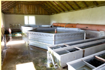
Odchov plôdika v novej rozkrmovni so stálym prítokom vody, ktorá bola postavená v roku 2012.