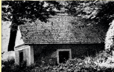
Budova starej liahne postavenej v čase založenia rybárne. Dnes už neexistuje. A building of an old hatchery built at the time of founding of the Fish Farm. It does not exist today.

Ako prvé boli vybudované tri väčšie rybníky nepravidelného tvaru a jeden obdĺžnikový – tzv. horné rybníky, ležiace priamo oproti hlavnej budove rybárne. Tá bola postavená ako nová liahňa v roku 1932, pôvodná stála pár desiatok metrov powyše prúdu. V roku 1962 boli budované tzv. dolné rybníky: 12 podlhovastých chovných nádrží (9 x 50 m), 24 nádrží (4 x 20 m) na odchov plôdika (dnes zaniknuté) a jeden väčší rybník v tvare trojuholníka.