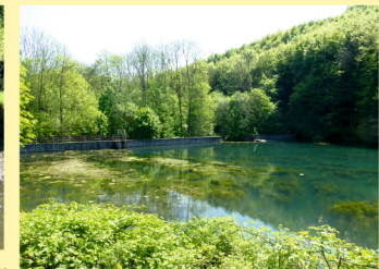
Priehradná nádrž na zachytávanie dažďových zrážok, vybudovaná nad rybnárou v roku 1993, čiastočne vyriešila problémy s nedostatkom vody v letných mesiacoch. A water dam for the retention of rainfall, built in 1993 above the fish pond, partially solved the problems with water deficiency in summer time.