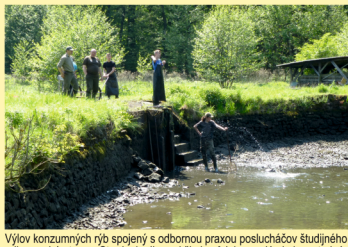
Výlov konzumných rýb spojený s odbornou prácou poslucháčov študijného odboru rybárstva zo Strednej odbornej školy pôdohospodárskej a veterinárnej v vankve pri Dunaji. Fishery of consumable fish connected with the professional experience of the students of the Fisheries Studies Department at the School in Vankva pri Dunaji