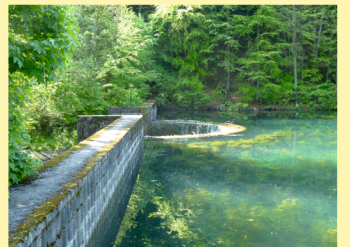
A water dam for the retention of rainfall, built in 1993 above the fish pond, partially solved the problems with water deficiency in summer time.